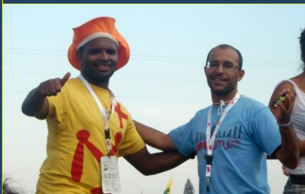
MJS Cabo Verde