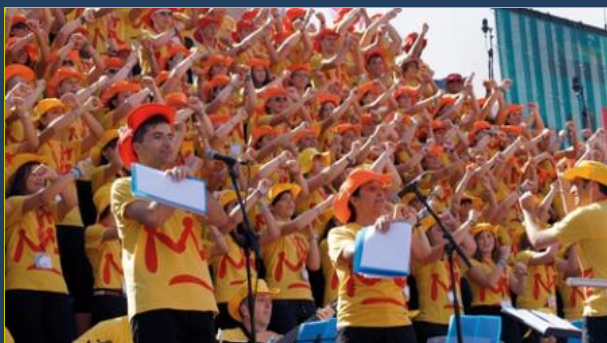
Coro da Festa MJS na JMJ, com a excelente participação dos jovens!