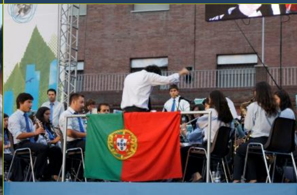
Banda de Poiars, atuou e encantou!