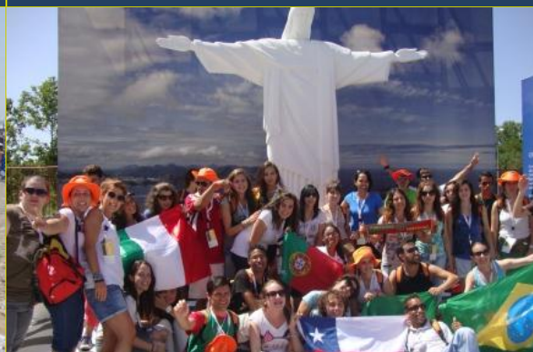
Grupo Canção Nova